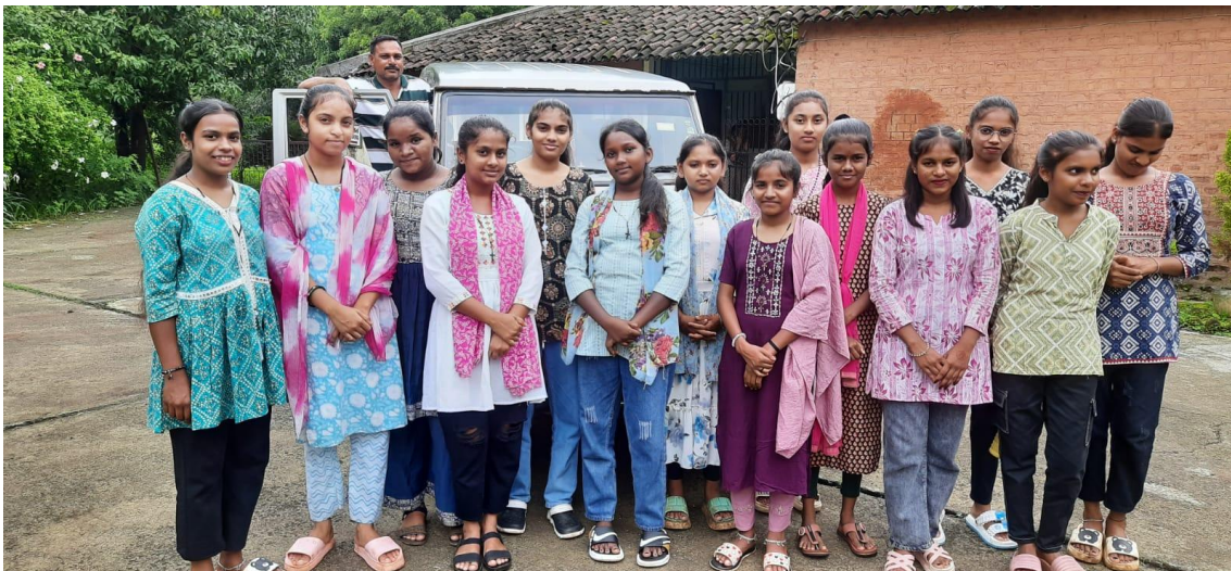
Estudiantes becasadas del internado de Umarpada- India

La donación tuvo lugar a finales de 2025, pero las compras de material y construcción se están llevando a lo largo de este año.