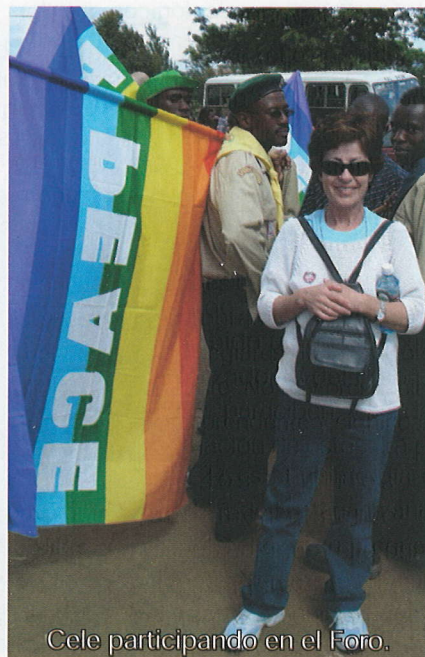
Cele participando en el Foro.

¿Qué incidencia puede tener el FSM en la creación de un sistema mundial e igualitario? El llamado tercer mundo, los pobres sufren los efectos de las políticas devastadoras de la globalización liberal y las dictaduras de los mercados conducidas por el FMI y el Banco Mundial. Ante esta situación el FSM representa un paso cualitativo en la consolidación de un contrapoder a nivel mundial y esa responsabilidad la tenemos todos, porque o hacemos que el FSM funcione o nos hundimos todos con él.